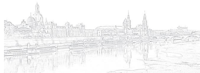
Titelfoto: Blick vom Japanischen Palais, Dresden Gestaltung: FRIEBEL Werbeagentur und Verlag GmbH