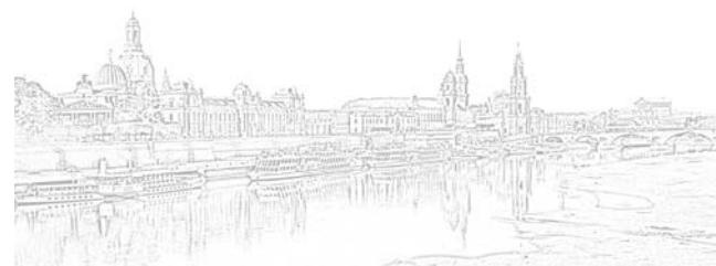
Titelfoto: Blick vom Japanischen Palais, Dresden