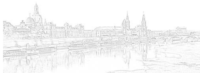
Titelfoto: Blick vom Japanischen Palais, Dresden