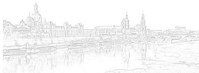
Titelfoto: Blick vom Japanischen Palais, Dresden Gestaltung: FRIEBEL Werbeagentur und Verlag GmbH