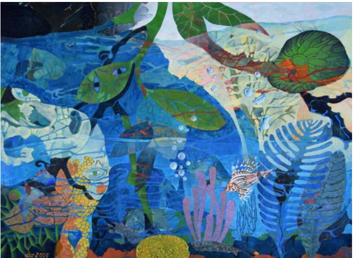
Das Meer. Mischtechnik auf Büttchen, 2015