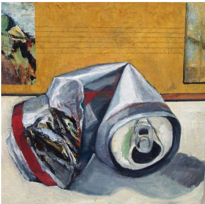
Zerquetschte Dose. Öl / Leinwand