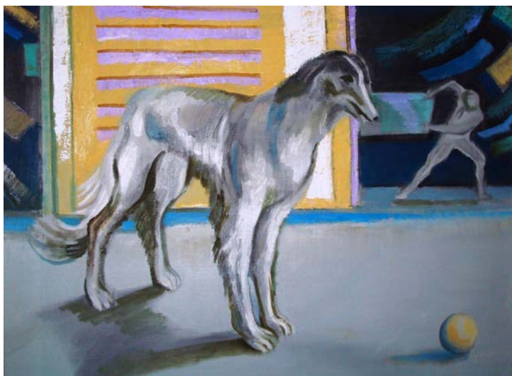
Windhund mit Ball. Öl auf Hanf. 2014/16